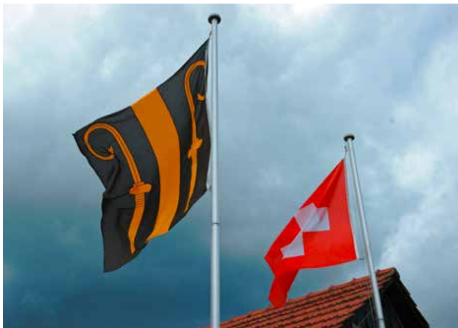
Salmsacher- und Schweizerfahne an der Storchengasse